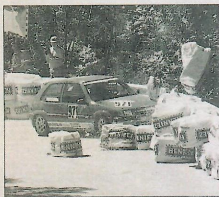
La coupe Citroën Saxo a vu Felix Brändle effectuer une spectaculaire sortie de route.

part de ses concurrents sont réduits au rôle de simples figurants.